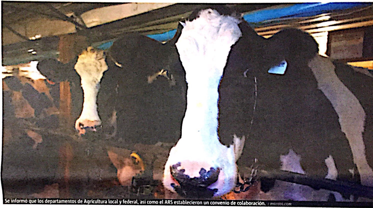
Se informó que los departamentos de Agricultura local y federal, así como el ARS establecieron un convenio de colaboración.