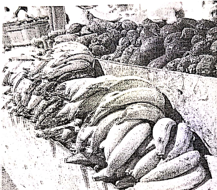
La creación de mercados agrícolas ha servido como punta de lanza en la estrategia de mercadeo para difundir la variedad de productos locales. > Fotos Eric Rojas/EL VOCERO

Otra estrategia para impulsar la actividad agrícola ha sido un plan de desarrollo basado en la canasta básica de alimentos. "Esto nos ha