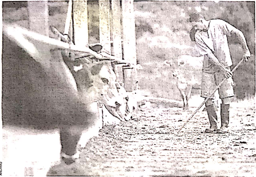
Tienen premura por concluir el proceso, ya que los ganaderos están recibiendo un subsidio del gobierno, el cual concluirá una vez esté lista la orden de precios.

●●● Anuncian que sesionarán en San Juan los jueces federales apelativos sobre la impugnación al acuerdo entre el gobierno y las plantas elaboradoras