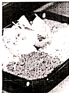
Los 90 restaurantes Taco Maker en la Isla solo servirán carne molida fresca 100% del País.