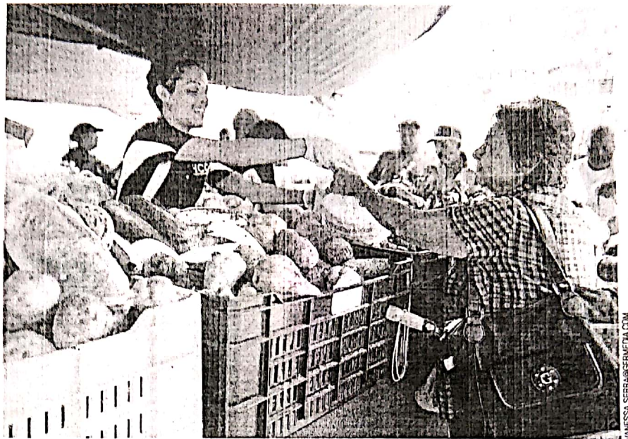
El Mercado Familiar se celebró ayer en la plaza pública de Caguas, y aunque inicialmente fue pensado para los beneficiarios del PAN, en la actualidad está abierto al público en general.

"Este mercado está en 44 pueblos y no está en más porque necesitamos más agricultores", sostuvo García Padilla, al asegurar que la Isla atraviesa por un repunte en la industria de la