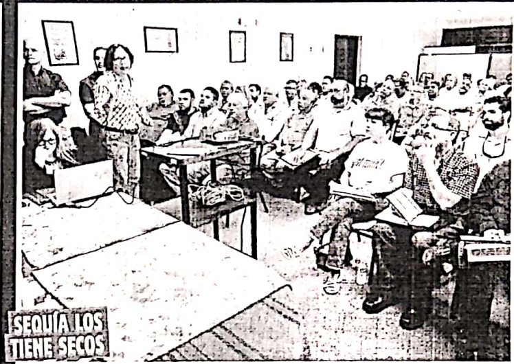
Agricultores y ganaderos se informaron ayer sobre las diversas ayudas disponibles para apaciguar el golpe que la ausencia de agua les está dando.

En el área sur ayer inició el plan de racionamiento a los abonados de Salinas, Coamo y Santa Isabel por periodos programados de 12 horas para reducir la extracción al acuífero del sur.